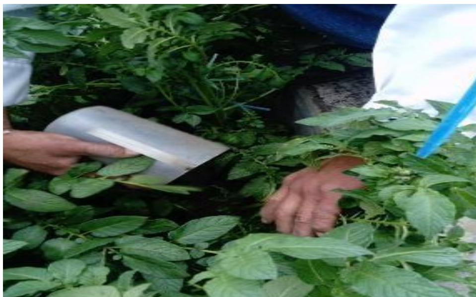
Figura 7. Primer y segundo aporque.

El Aporque se realizó para que el cultivo tenga mayor sostenimiento, permitiendo airear el suelo. También ayudó en el control de malezas, plagas y proporcionar bastante tierra para la formación adecuada de tubérculos.