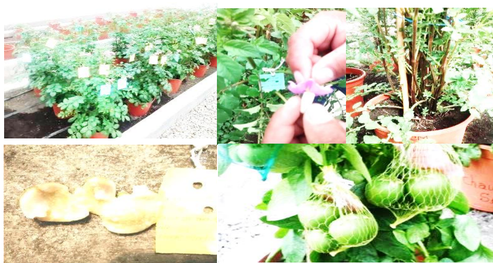
Figura 1. Obtención de la semilla botánica.

3.7.2.1 Obtención de la semilla botánica. Para la obtención de los 4500 híbridos se procedió con la siembra directa de los padres de 6 variedades de papas nativas de pulpa coloreada. Se utilizó un sustrato, con cantidades de 2 partes de tierra y una de estiércol de ovino, esta mezcla se colocó en 30 macetas de 30 cm x 15cm para las seis variedades. Posteriormente se realizó la siembra de las papas nativas en las respectivas macetas. Luego se incorporó dos tapitas de urea de botella de agua y dos jarras de sustrato de 600kg en cada maceta. Esta labor se realizó cuando el cultivo alcanza un tamaño de 15 a 20cm. También se realizó el guiado de las plantas de papa para evitar que el área foliar de las plantas se dañe y puedan causar pérdidas de bayas. Posteriormente se recolecto las anteras manualmente y se extrajo el polen para realizar la polinización sobre los estigmas de las flores femeninas, una vez extraído el polen del padre masculino se colocó en los estigmas de las flores femeninas de las plantas madres, este proceso se realizó con mucho cuidado, así se obtuvo las semillas botánicas de las cuales se seleccionaron 4500 semillas para realizar la investigación en la identificación de híbridos precoces. y muy precoces.