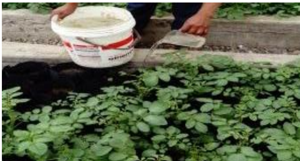
Figura 6. Riego de 500ml por bolsa.

e) Riego. El riego se realizó con una frecuencia de 500ml por bolsa cada tres días evitando la excesiva cantidad de agua, esta se realizó manualmente con una jarra con de la medida mencionada.