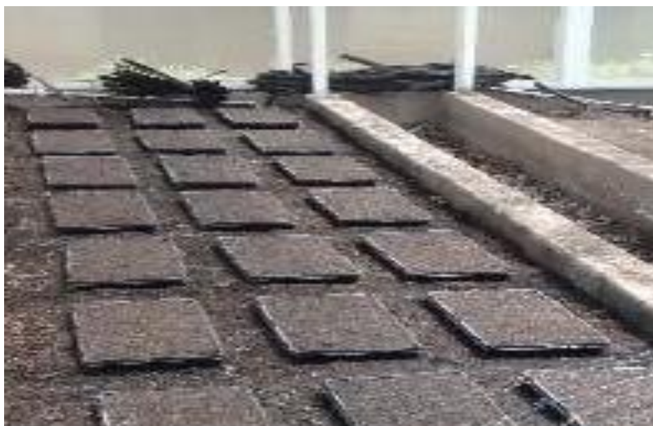
Figura 2. Preparado del sustrato en bandejas.

a) Preparación de sustrato para almacigo. Se preparó el sustrato de la siguiente manera: 2 partes de tierra negra, 1 parte de estiércol y 1 parte de arena. Obteniendo un sustrato franco arenoso. Esta mezcla ayudo a la semilla en la germinación uniforme. Al momento de la siembra se procedió al remojo las semillas botánicas, con el fin de romperla latencia y tener una germinación vigorosa. La semilla se colocó manualmente en las bandejas de almacigado una por una.