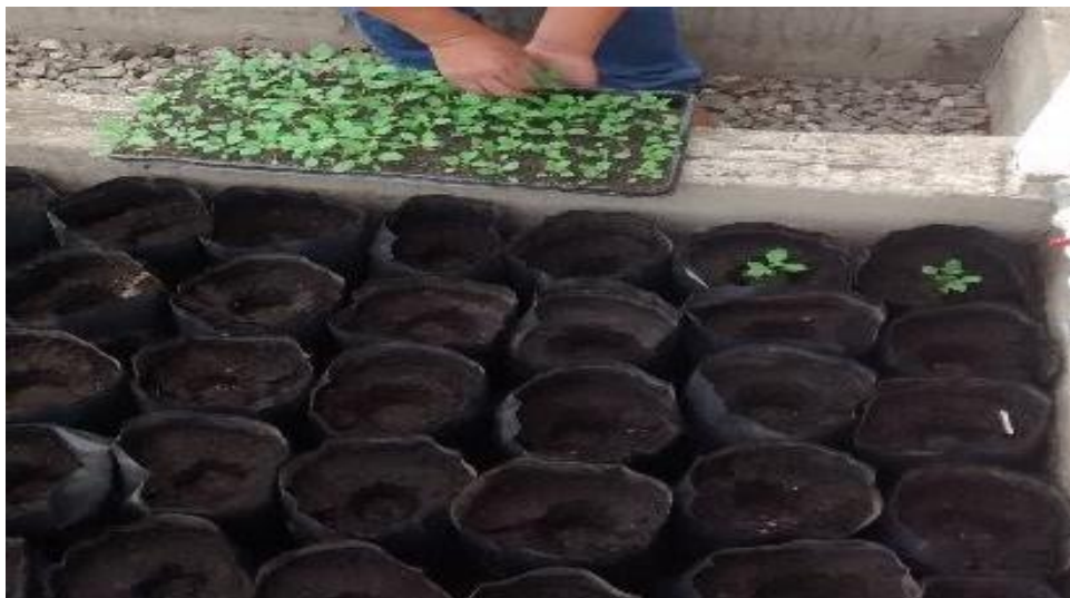
Figura 5. Trasplante de plántulas de papa.

d) Repique. El repique consistió en el trasplante de las plántulas de papa de la bandeja de almacigado hacia las bolsas.