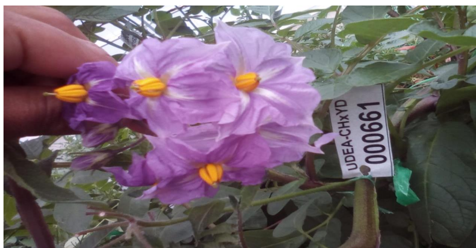
Figura 10. Codificado de híbridos.