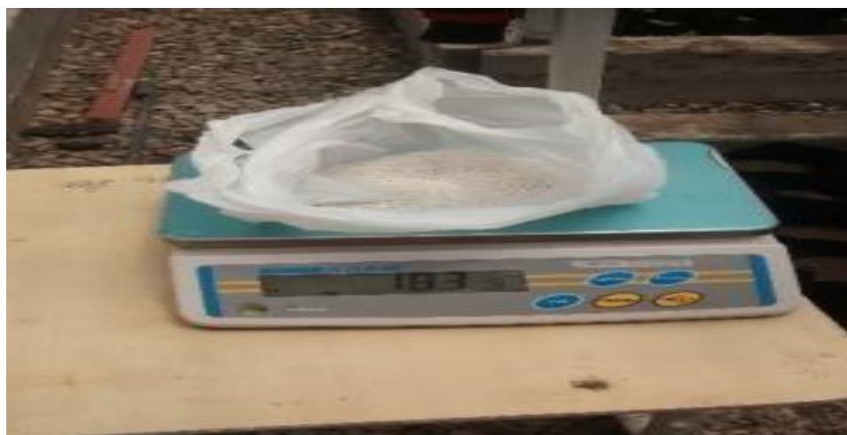
Figura 4. Mezcla y pesado de fertilizantes.

Se utilizó una formulación de 100 – 90 – 90 de NPK, El nitrógeno se aplicó fraccionado (mitad a la siembra y mitad al aporque) para evitar pérdidas de este nutriente por un exceso de agua. En algunas situaciones puede no ser necesario el fraccionamiento y en otros casos se aplica en mayor número de fracciones.