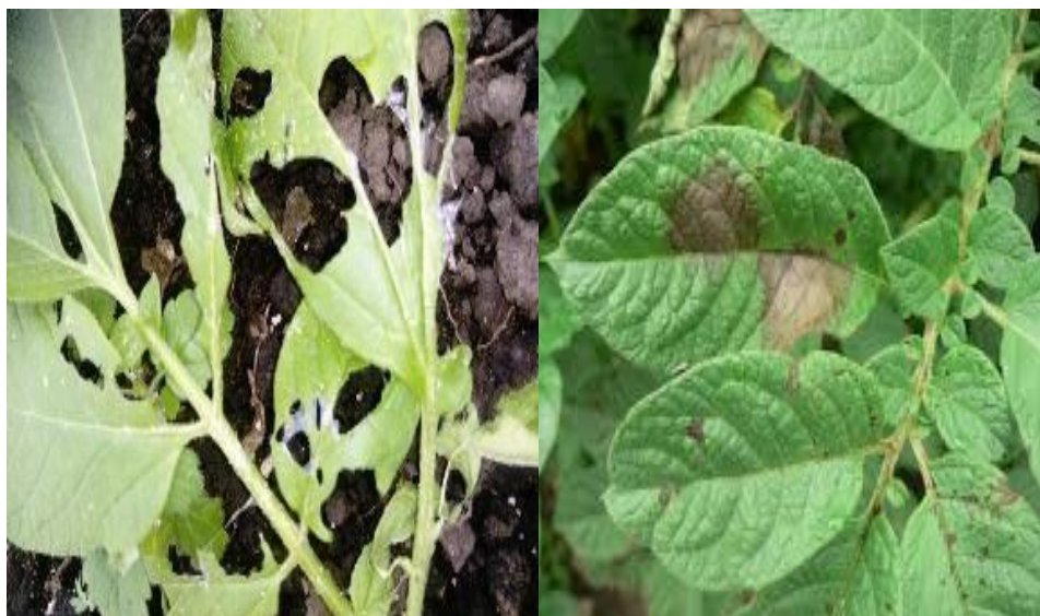
Figura 9. Daño de plagas de papa.