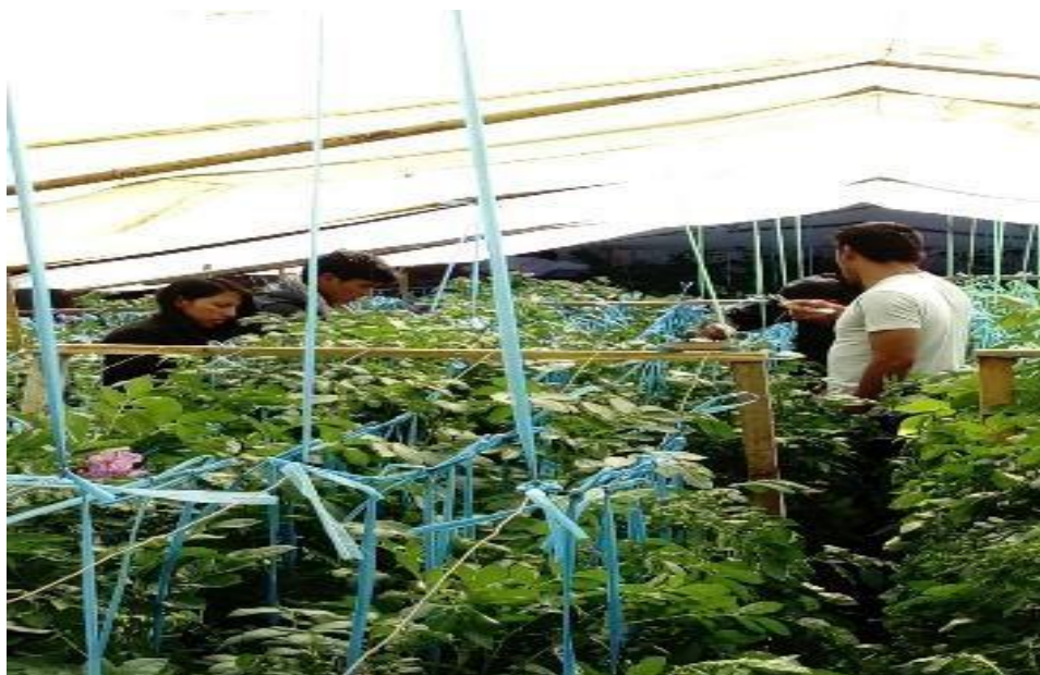
Figura 8. Tutorado de la planta de papa.