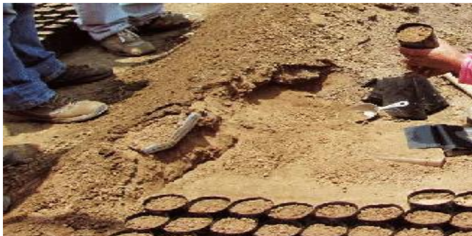
Figura 3. Embolsado de sustrato.