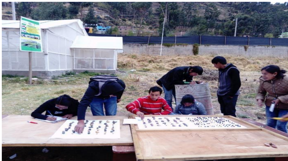
Figura 11. Evaluación a los 120 días de todos los híbridos.

j) Evaluación. La evaluación se realizó a los 120 días después de la siembra, donde se evaluó los 4500 híbridos de acuerdo a su escala de maduración (muy precoz y precoz. Tales como planteamos en los objetivos de la investigación.