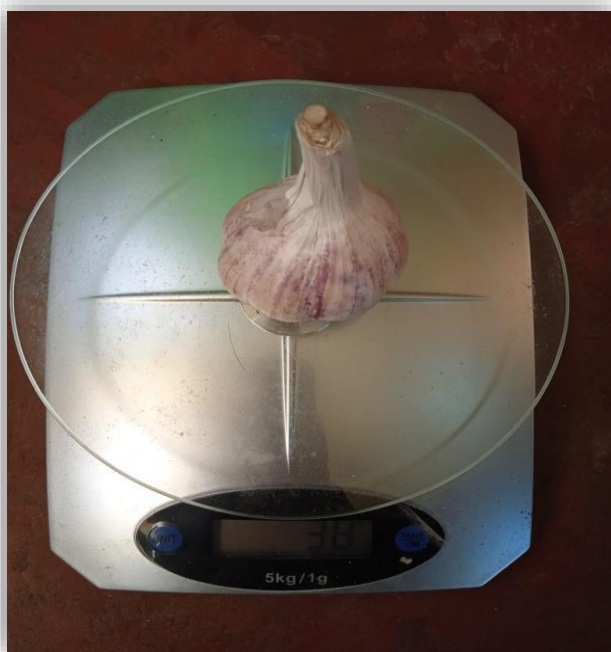
Peso de bulbo