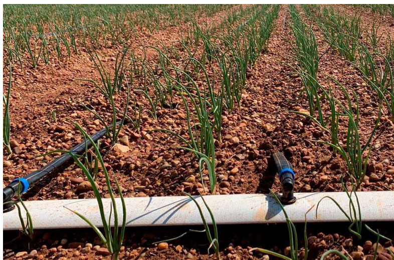
Riego por goteo