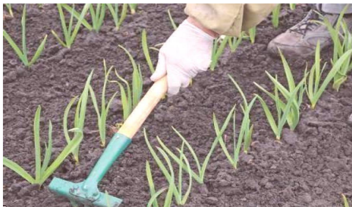
Aporque de ajo