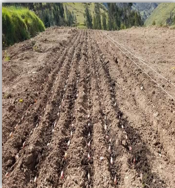
Instalación del experimento.