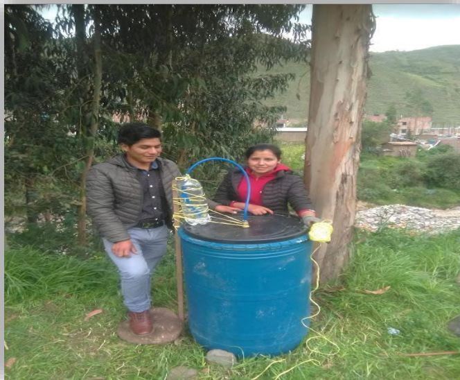
Elaboración de MM líquido