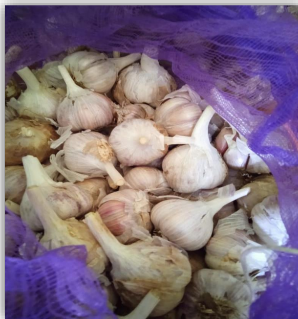
Peso de bulbos por tratamiento