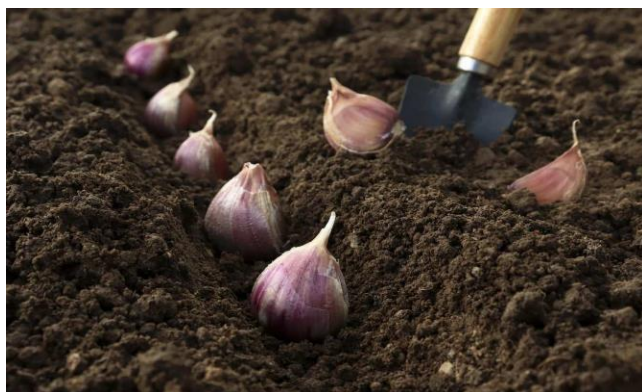
Siembra de ajo en surco