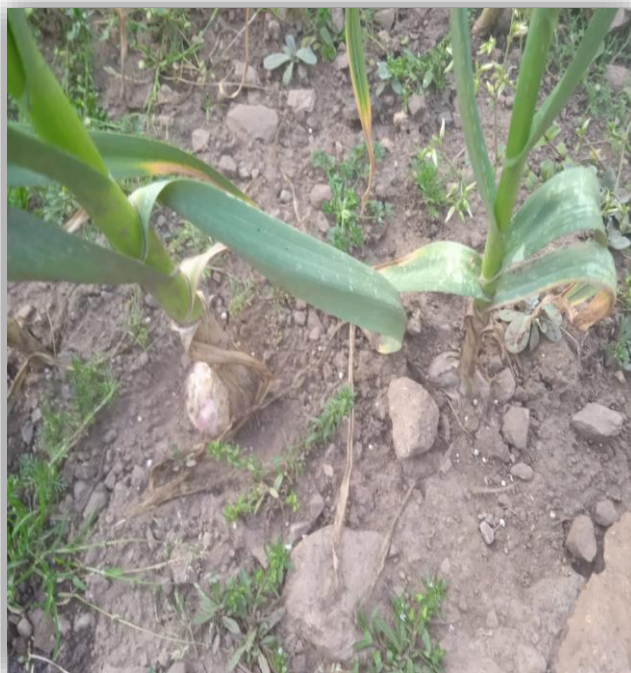
Desarrollo del bulbo de ajos