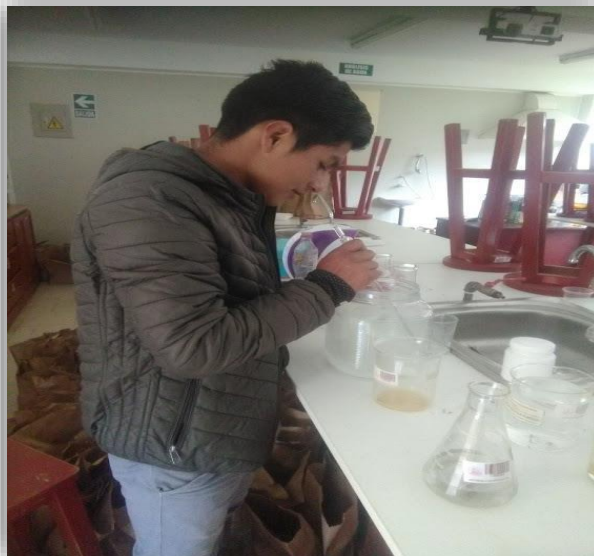
Elaboración de ORMUS