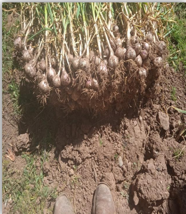
Cosecha de bulbo por tratamiento