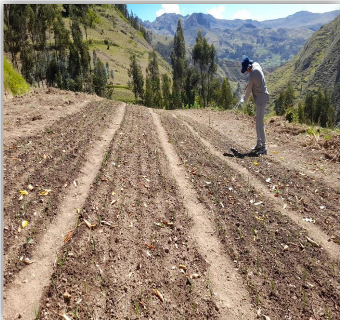
Riego al campo experimental.