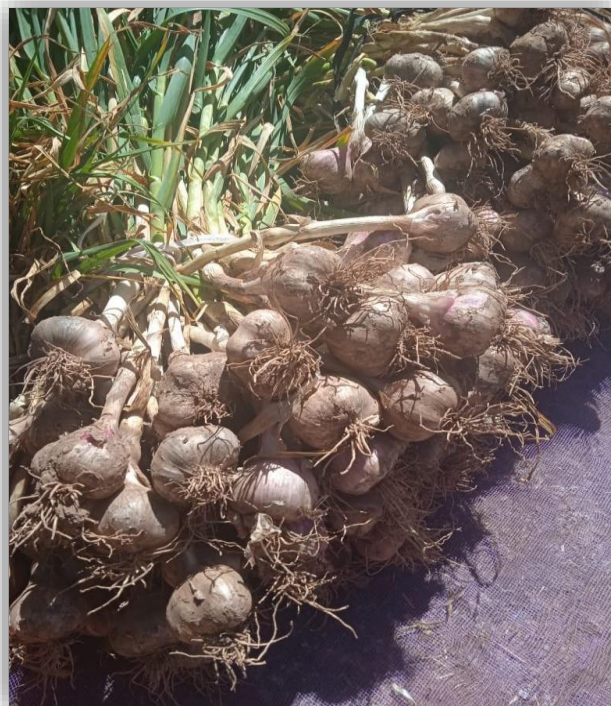
Cosecha de bulbo por surco