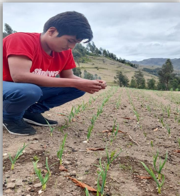
Evaluación de porcentaje de germinación.